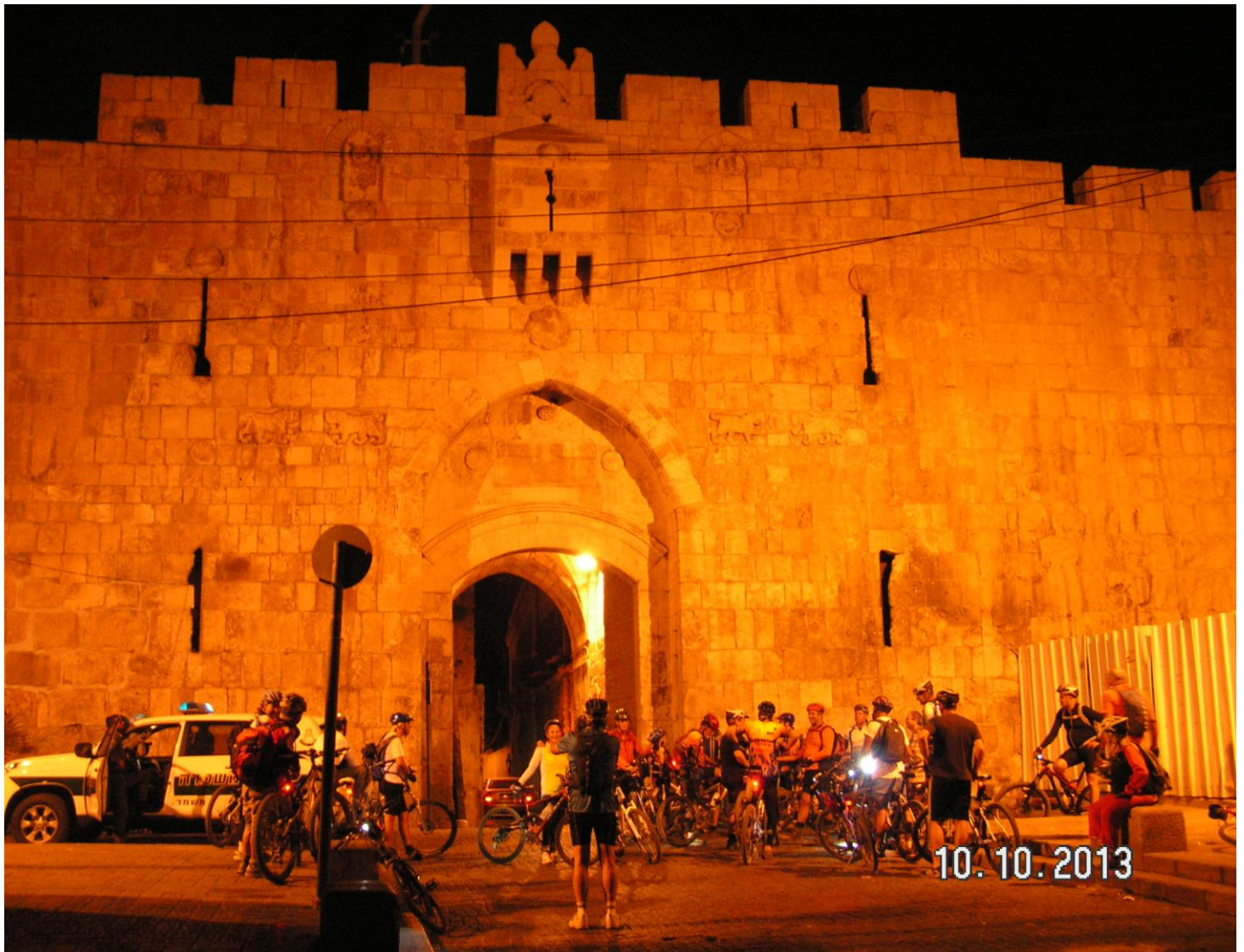
רכב וצילם: אברהם אילת

למטה: קבוצת הרוכבים נכנסת לעיר העתיקה דרך שער האריות בעקבות לוחמי הצנחנים של מוטה גור בקרבות ששת הימים.