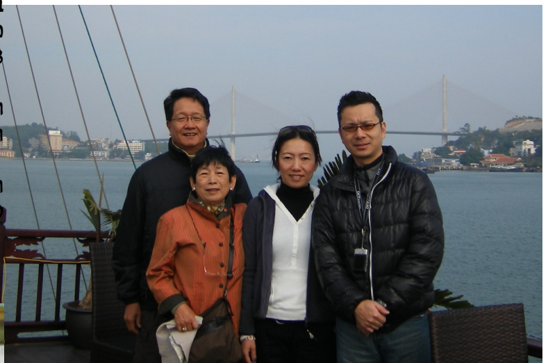
קנג'י ומשפחתו בוויאטנאם