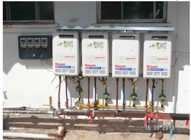
ארבע יחידות גז לחימום מים במכבסה

ההוצאות הקבועות ובעיקר את הפסדי האנרגיה בקיטור ובקווי ההולכה. למרות כל מאמצי ההתייעלות שנקטנו חצי מייצור הקיטור התבזבז על הפסדי האנרגיה.