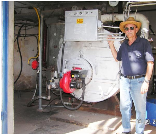
אסא ליד מתקן הקיטור הקטן עם מבער הגז

בפועל תסתיים שנת 2013 בהוצאה על חימום ומעתה בגז, של 360.000 ₪ השנה הבאה שנת 2014 צפויה להסתיים בהוצאה של 290.000 ₪.