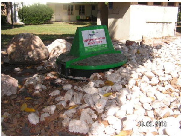
מיכל גז טמון ליד המכבסה

בראשון לנובמבר בשנה שעברה, הפכנו לקיבוץ מתחדש. גם ניהול האנרגיה בקיבוץ התחייב להחליף את הדיסקט. כל שירות ופעילות בקיבוץ יש לבחון לאור שינוי הרגלי הצריכה, בעקבות ההפרטה. מגמת היעול של שירותי הקיבוץ והפיכתם למרכזי רווח עצמאיים, מחייבת פעולות שלא נעשו קודם לכן.