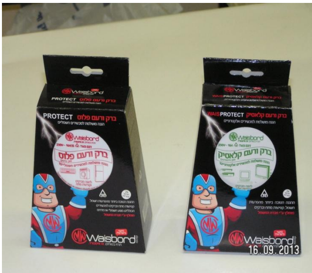
מועדים לשמחה החשמלאים

להמחשה: – תמונת שני המכשירים הנ"ל הנמצאים בחשמליה זמנים לרכישה.