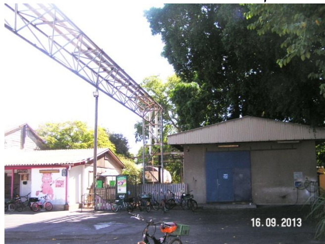
בית הקיטור הישן - מלא היסטוריה מקומית

נתחיל בקצת היסטוריה לפני 41 שנים נבנה מתקן הקיטור הגדול, בבנין מול המטבח.