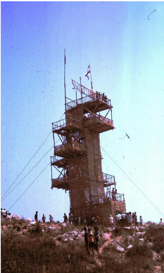
מגדל מרשים משומריה לפני שנים