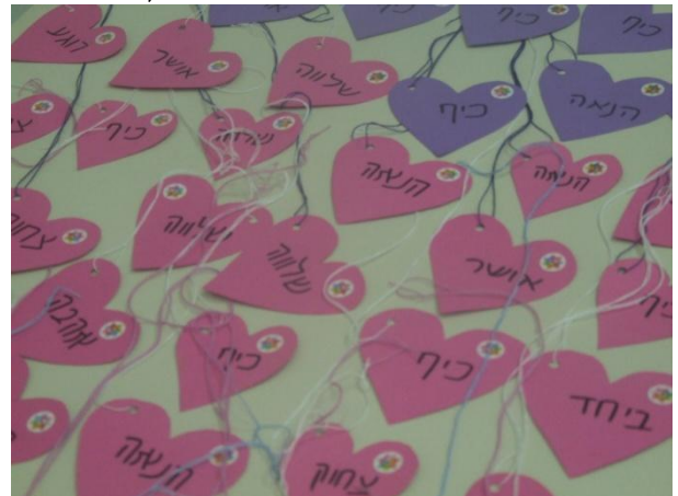
אחת מהיצירות שהכינו במהלך הפסטיבל.