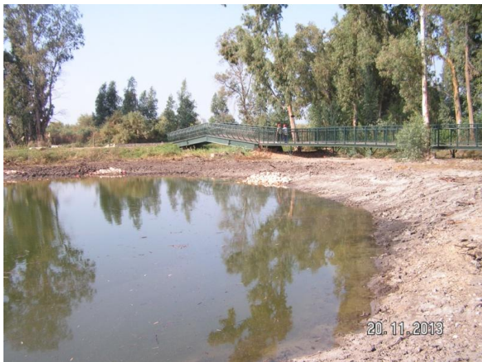
מבט על האגמון ממזרח וברקע – הגשר