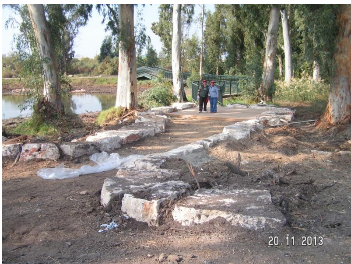
השביל מזרחה – עדיין בשלבי עבודה ומילוי