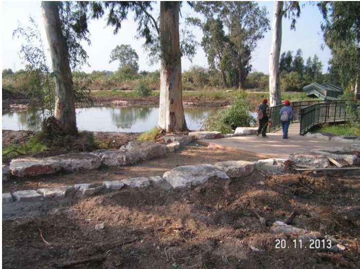
שתי מטיילות על השביל ליד הגשר והאגמון.