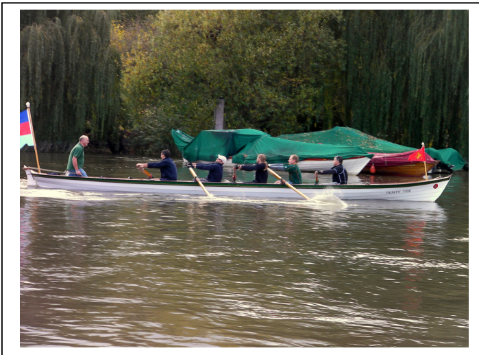
הסירה Trinity Tide מפליגה לאורך התמזה באימון לקראת האולימפיאדה

מעטים האנשים שזכו בכבוד לקחת חלק ביום זה.