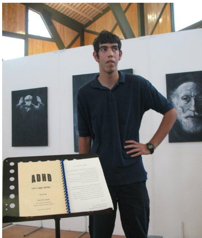
נווה היכל – התקבל למכינה קדם צבאית "לכיש" בקיבוץ בית גוברין והוא יתגייס לאחר שיסיים את המכינה בעוד שנה.