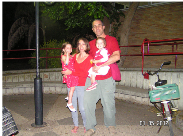
משפחת כרמלי בחולצות אדומות (תסתכלו בגיליון שמופיע באינטרנט..) מתייצבת לארוחת הערב המשותפת.