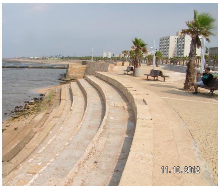
הטיילת בעכו – נקודת הזינוק לטיול