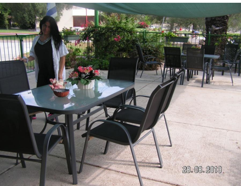
פינת ישיבה חדשה במרפסת בית עזר