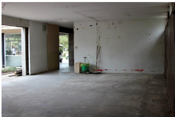
שתי תמונות מעבודות השיפוץ שמתבצעות בימים אלו בגלריה