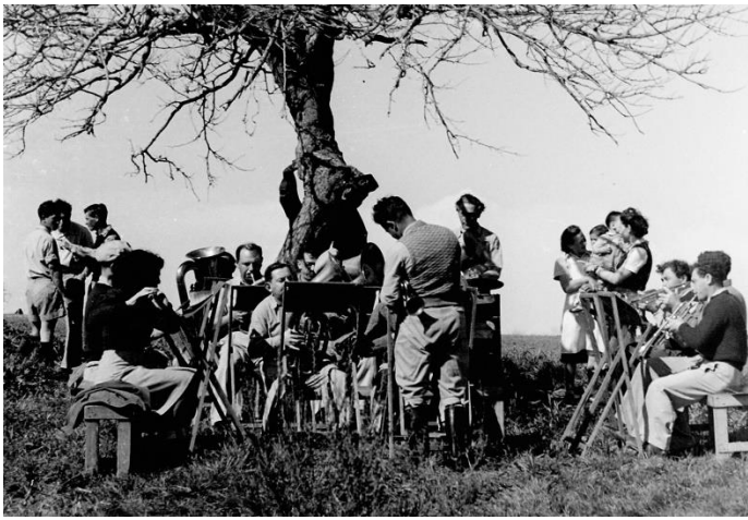
ותמונה נוספת מאותו אירוע – ילדי קבוצת שחף (בעיקר) וברקע שורת צריפים ראשונים בקיבוץ הצעיר כפר מסריק.