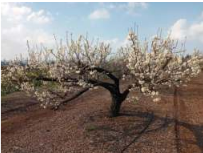
והשקד פורח במלוא עוזו