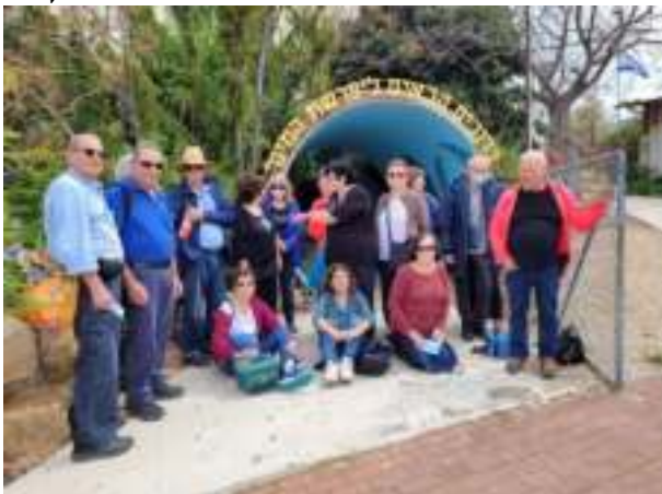
טיול הגמלאים לאמת המים ליד רגבה