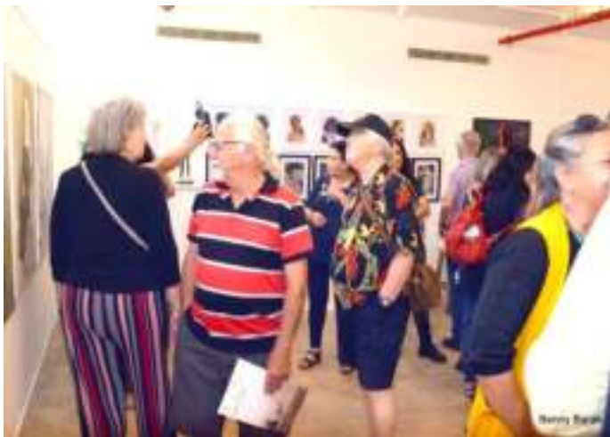
מבקרים בתערוכה לאחר הטקס