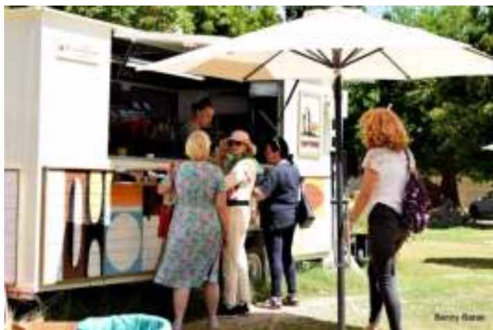
מתכבדים בקפה ומאפה בקרון "צ'כוליטא"