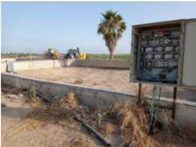
בריכות בטון שמוחזרות לשימוש אחרי 25 שנה

לאחר אישור התוכנית ההנדסית במשרד החקלאות אושר בוועדת התקציבים למדגה כפר מסריק השקעה בגובה 5.4 מיליון ₪ מהם כ 60% מענק במסגרת הרפורמה.