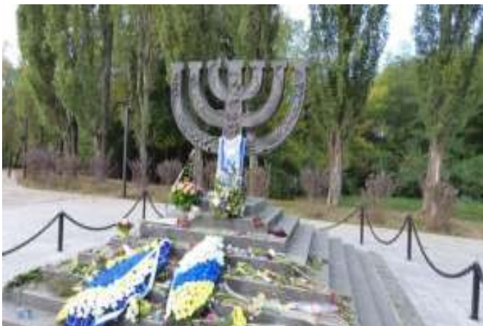
האנדרטה לנרצחים היהודיים ב- באבי יאר

רק בשנת 1991 הוצבה אנדרטה לזכר הקורבנות היהודים של באבי יאר.