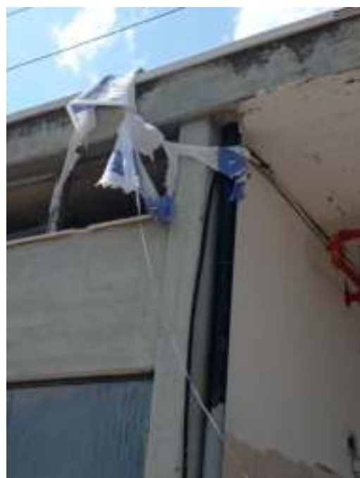
שאריות דגל ישראל על מבנה ציבור