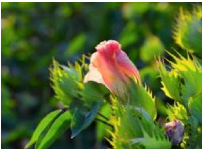
כתב וצילם: רון כהן