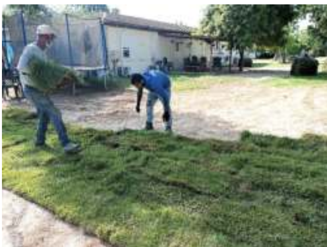
צוות העובדים בכיסוי השטח בדשא מוכן