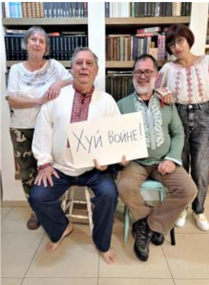
מעבירים מסר חד משמעי לפוטין

אידה: אסור להגיד את המילה מלחמה. רק מבצע.