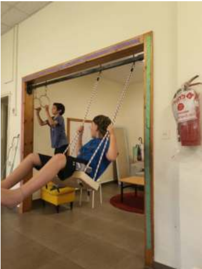
המתקנים החדשים שאנחנו נהנים מהם מאד.