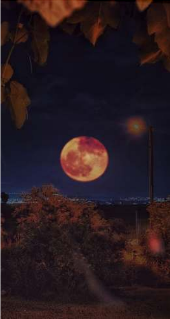
כתב וצילם: רון כהן