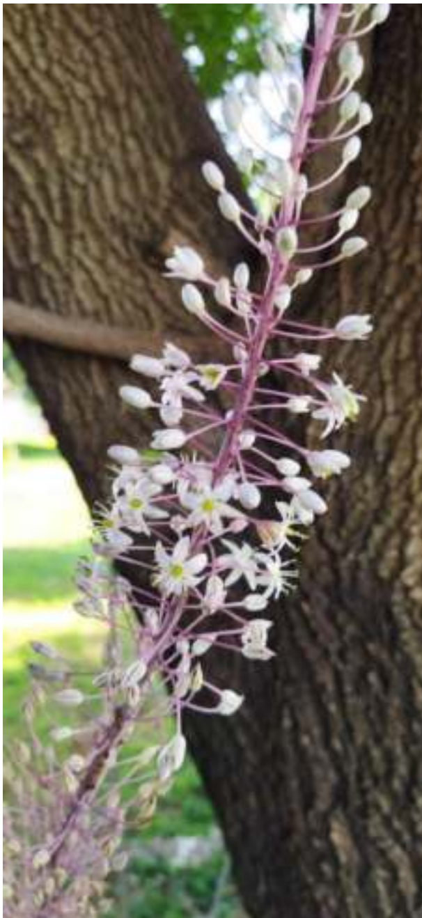
כתבה וצילמה: גליה שטיין

שתהיה שנה טובה, מעניינת והכי חשוב - בריאה.