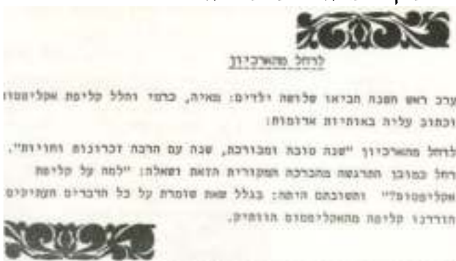
וכאן – ברכה מהמרח"בים

צוות הארכיון משתף אותנו בברכות מהעבר הרחוק שהופיעו בהד-הנעשה. למטה: ברכה שנמסרה לרחל (רודני) קליין שניהלה את הארכיון – מילדי חברת הילדים.