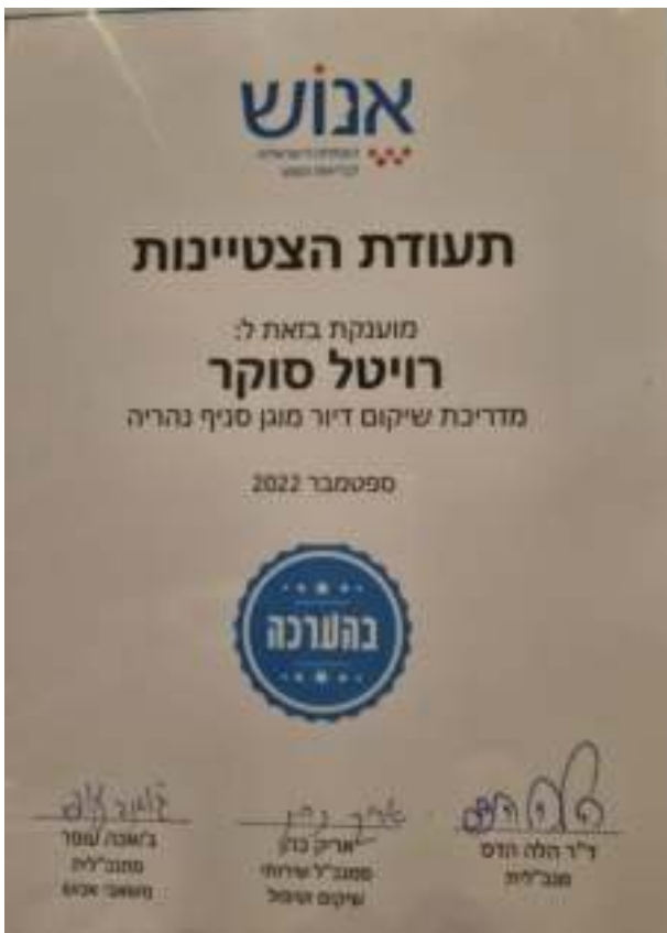
תעודת ההצטיינות של רויטל.