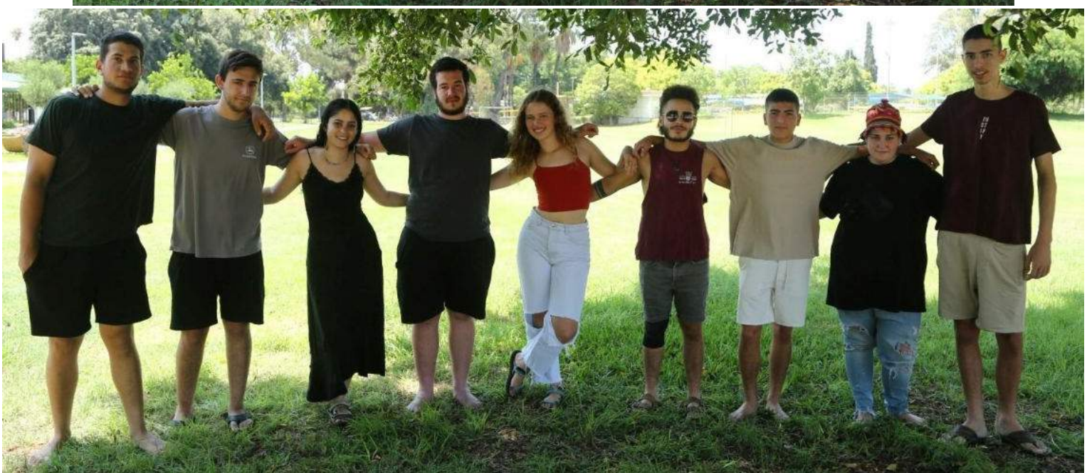
את תמונות השער וגם את התמונות האיטיות צילם: רמי כהן