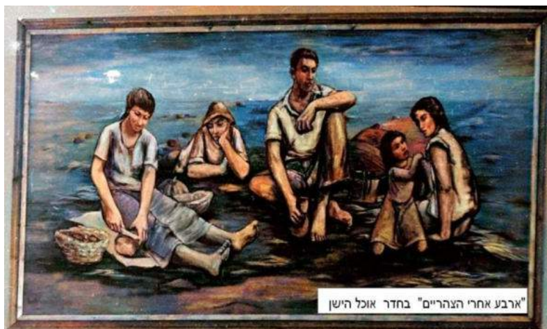
"ארבע אחרי הצהריים" בחדר אוכל הישן