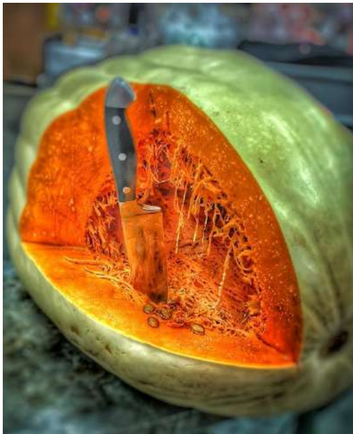
כתב וצילם: רון כהן-פריא

הדלעת החתוכה הענקית שחיכתה לי בכלבו העיפה אותי לזיכרונות ילדות אי שם פעם במכולת של משיח, בפתח תקוה כשהכל היה פשוט להפליא כמו הדלעת הזו בכלבו. משיח, אבא של רונית מהכיתה שלי פתח את חנות הירקות שלו בבקתה קטנה בשכונת ילדותי. בסך הכל רצה לפרנס את משפחתו. היום היו קוראים לו יזם, עצמאי והוא ראה עצמו רק מוכר קשה-יום במכולת השכונתית. אני בעד המילה יזמות ובעד היזמים. והחודש הזה בו אנחנו מציינים את היזמים בקיבוץ - שמוכרים את מרכולתם זו הזדמנות נפלאה לברך אותם ולהודות להם על היוזמה והעשייה. עבורי, כל אחת מכם הוא המשיח כמו מוכר הירקות מילדותי