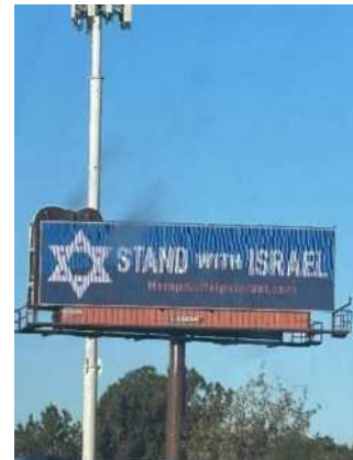
שלט חוצות שצילמנו והתרגשנו

אני ארגנתי אירוע באחת מהכנסיות באיזור. הכרתי זוג שמקורב לכנסייה ושהם אוהבי ישראל אדוקים. יום או יומיים אחרי ה 7 לאוקטובר, דיברתי עם חברה שלי מפרדס חנה בטלפון בדיוק כשעצרתי לבקר את הזוג הזה. קארל המארח, התחיל לדבר איתי על מה שקרה בישראל ועל כמה הם מאמינים שאנחנו ננצח ושנאנחנו העם שהם מחויבים להגן עליו, עד כמה הם אוהבים אותנו ואיתנו. והחברה בטלפון שומעת את כל זה ובוכה ובוכה. התמיכה שהוא הרעיף עלינו במילים היתה כמו מים זכים ששטפו את שתינו.