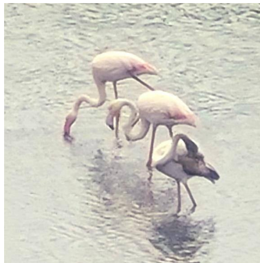
להקת פלימנגו אצלנו בבריכות