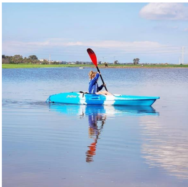
בר זקין משייט באגם הביצה

אבל כידוע הופרכה דאגה זו בגשמי החנוכה, נפתחו ארובות השמיים והחורף התפרץ לאזורנו במלא תפארתו. גשם החל לרדת ללא הפסקה, ונחל החילזון עלה על גדותיו, מציף את העמק שלנו במראות נשכחים זה מכבר. להקות הפלמינגו החולפות בשטחנו הוסיפו עניין רב למטיילים שבאו לחזות בשיטפונות ולקבל מנת אופטימיות חורפית נשכחת.